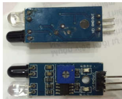
Cảm biến hồng ngoại