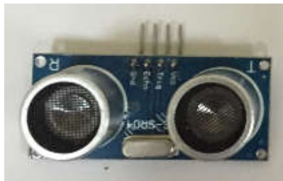
Cảm biến siêu âm